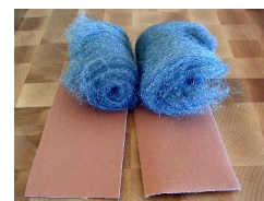
Laine d'acier et papier sablé