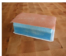
Bloc à poncer